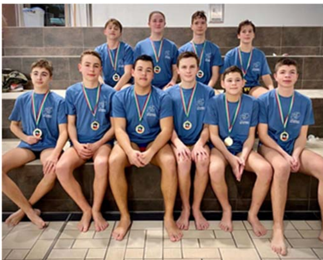
Team Ruhrgebiet 1