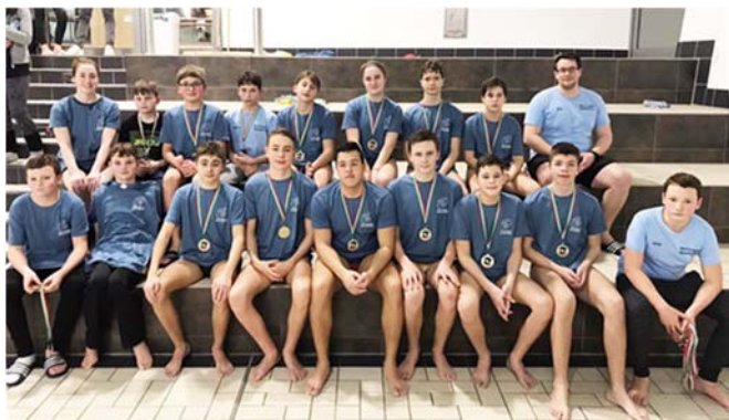
Team Ruhrgebiet 1 und 2